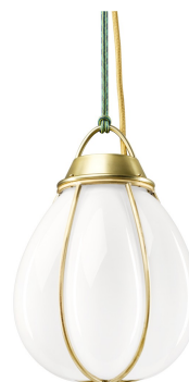
LITEN, RÅ MÄSSING